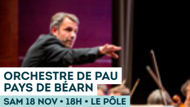
ORCHESTRE DE PAU PAYS DE BEARN SAM 18 NOV • 18H • LE PÔLE