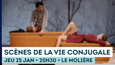
SCÈNES DE LA VIE CONJUGALE JEU 25 JAN • 20H30 • LE MOLIÈRE