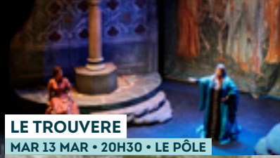
LE TROUVERE MAR 13 MAR • 20H30 • LE PÔLE