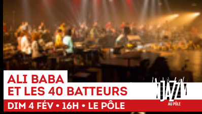
ALI BABA ET LES 40 BATTEURS DIM 4 FÉV • 16H • LE PÔLE