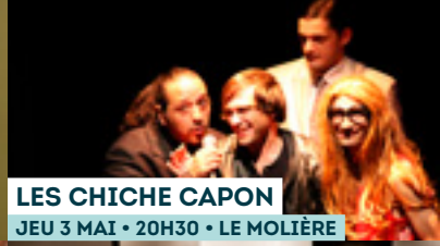
LES CHICHE CAPON JEU 3 MAI • 20H30 • LE MOLIÈRE