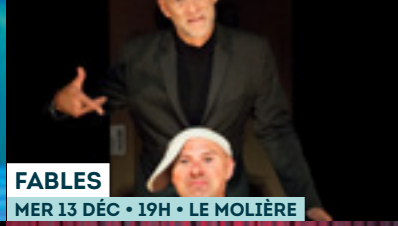
FABLES MER 13 DÉC • 19H • LE MOLIÈRE