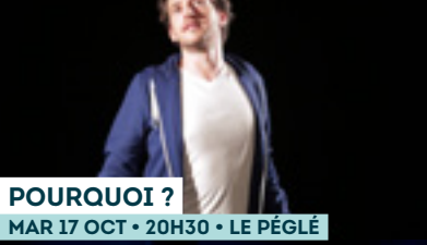
POURQUOI ? MAR 17 OCT • 20H30 • LE PÉGLÉ