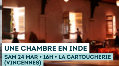
UNE CHAMBRE EN INDE SAM 24 MAR • 16H • LA CARTOUCHERIE (VINCENNES)