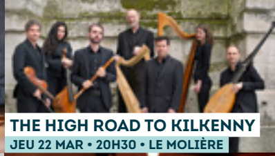
THE HIGH ROAD TO KILKENNY JEU 22 MAR • 20H30 • LE MOLIÈRE