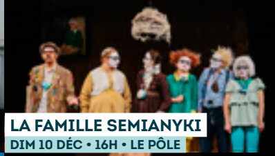
LA FAMILLE SEMIANYKI DIM 10 DÉC • 16H • LE PÔLE