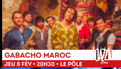
GABACHO MAROC JEU 8 FÉV • 20H30 • LE PÔLE