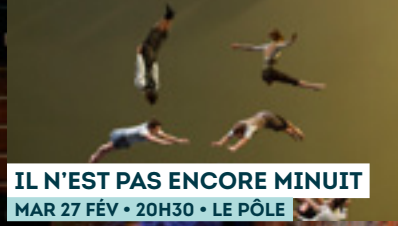
IL N'EST PAS ENCORE MINUIT MAR 27 FÉV • 20H30 • LE PÔLE