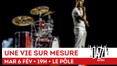
UNE VIE SUR MESURE MAR 6 FÉV • 19H • LE PÔLE