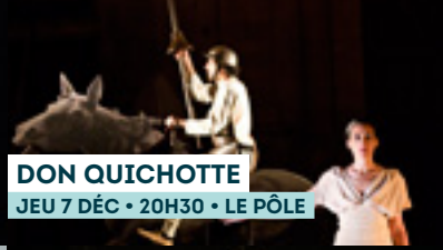
DON QUICHOTTE JEU 7 DÉC • 20H30 • LE PÔLE