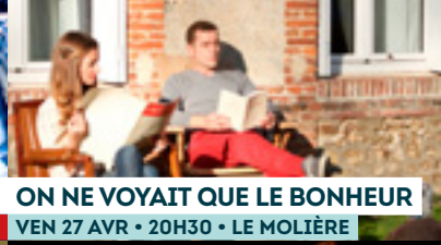
ON NE VOYAIT QUE LE BONHEUR VEN 27 AVR • 20H30 • LE MOLIÈRE