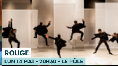
ROUGE LUN 14 MAI • 20H30 • LE PÔLE