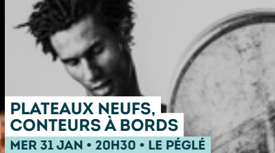
PLATEAUX NEUFS, CONTEURS À BORDS MER 31 JAN • 20H30 • LE PÉGLÉ