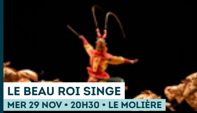
LE BEAU ROI SINGE MER 29 NOV • 20H30 • LE MOLIÈRE