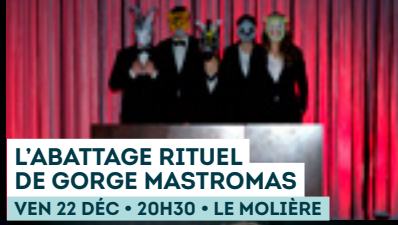
L'ABATTAGE RITUEL DE GORGE MASTROMAS VEN 22 DÉC • 20H30 • LE MOLIÈRE