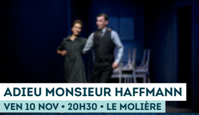
ADIEU MONSIEUR HAFMANN VEN 10 NOV • 20H30 • LE MOLIÈRE