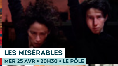
LES MISÉRABLES MER 25 AVR • 20H30 • LE PÔLE