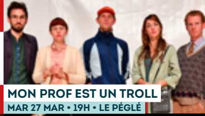
MON PROF EST UN TROLL MAR 27 MAR • 19H • LE PÉGLÉ