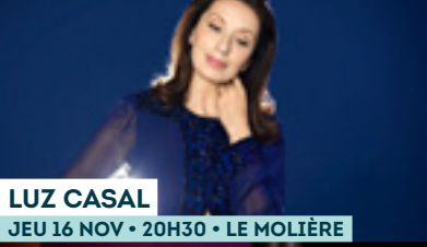
LUZ CASAL JEU 16 NOV • 20H30 • LE MOLIÈRE