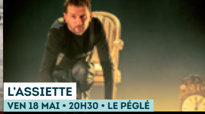
L'ASSIETTE VEN 18 MAI • 20H30 • LE PÉGLÉ