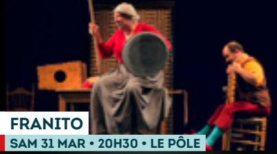
FRANTO SAM 31 MAR • 20H30 • LE PÔLE