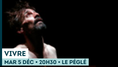
VIVRE MAR 5 DÉC • 20H30 • LE PÉGLÉ