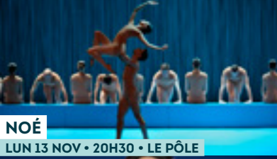
NOÉ LUN 13 NOV • 20H30 • LE PÔLE