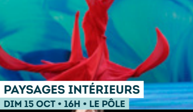
PAYSAGES INTÉRIEURS DIM 15 OCT • 16H • LE PÔLE