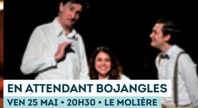
EN ATTENDANT BOJANGLES VEN 25 MAI • 20H30 • LE MOLIÈRE